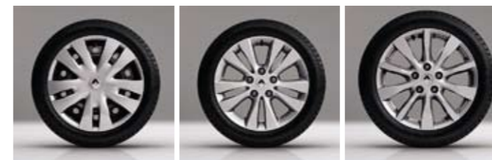
Декоративный колпак BLASON 16"